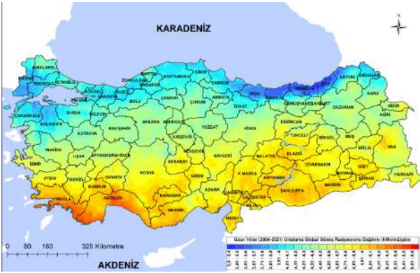
Şekil 1. Türkiye güneş enerjisi potansiyeli atlası [4]

Güneş enerjisi santralleri, büyük güneş pillerinin kullanıldığı sistemlerdir. Güneş pilleri fotovoltaiik olup kristal silisyum ve galyum arsenitten oluşmaktadır. Bu sistem güneş ışınlarından gelen enerji elektrik enerjisine çevirmektedir. Türkiye'nin jeolojik konumu göz önüne alındığında özellikle güney kesiminde şekil 1 'deki radyasyon haritasında gösterildiği gibi güneş enerjisinden yılın büyük bir bölümünde faydalanmak mümkündür.